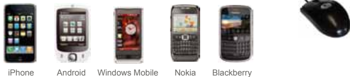
iPhone Android Windows Mobile Nokia Blackberry